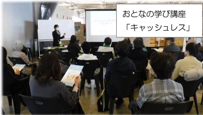
おとなの学び講座 「キャッシュレス」