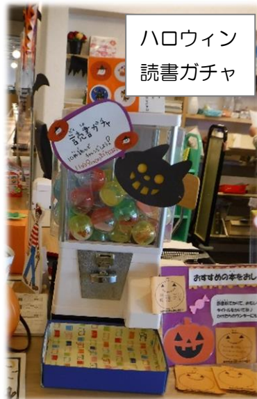
ハロウィン 読書ガチャ