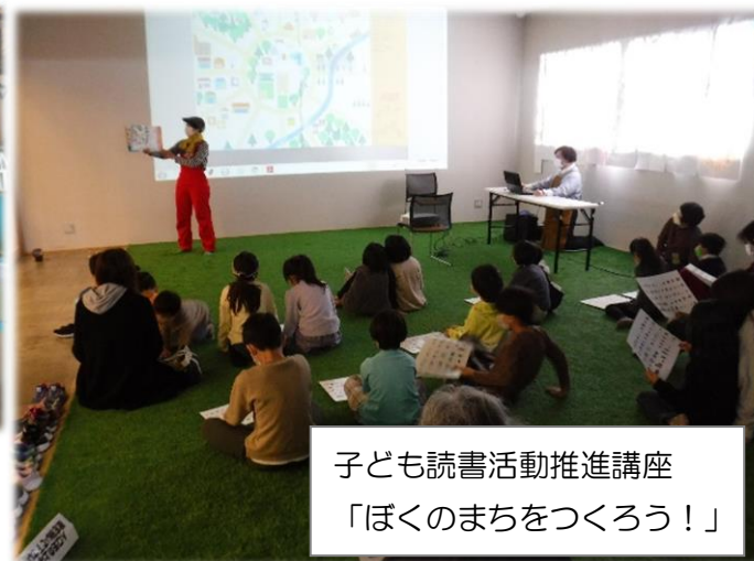
子ども読書活動推進講座 「ぼくのまちをつくろう！」