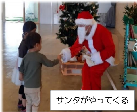
サンタがやってくる