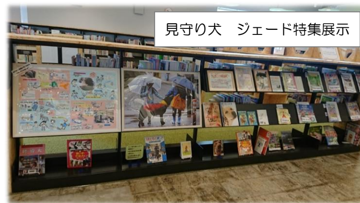
見守り犬 ジェード特集展示