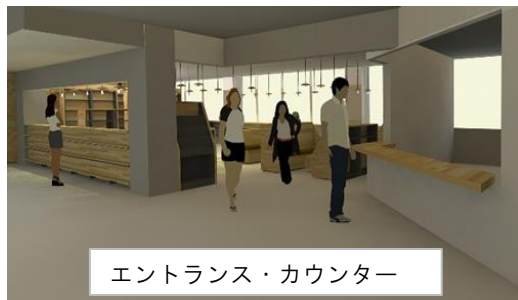
エントランス・カウンター