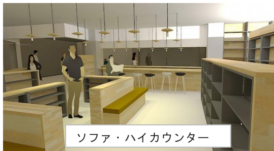
ソファ・ハイカウンター