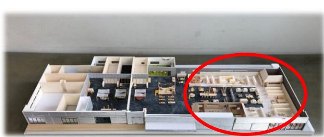
ミルキーウェイクエア内 (仮称) 図書交流館 牧之原市波津3丁目地内