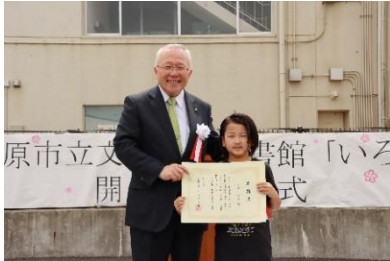
愛称命名者へ感謝状贈呈

令和6年4月21日、文化の森図書館「いろ葉」が開館した。初日は来賓約40人を招待して開館式典を実施。榛原高校生によるイベントも行い、約1,000人の方が来館した。