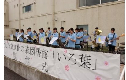
榛原高校吹奏楽部の演奏