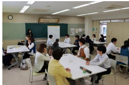
多世代交流ワークショップ